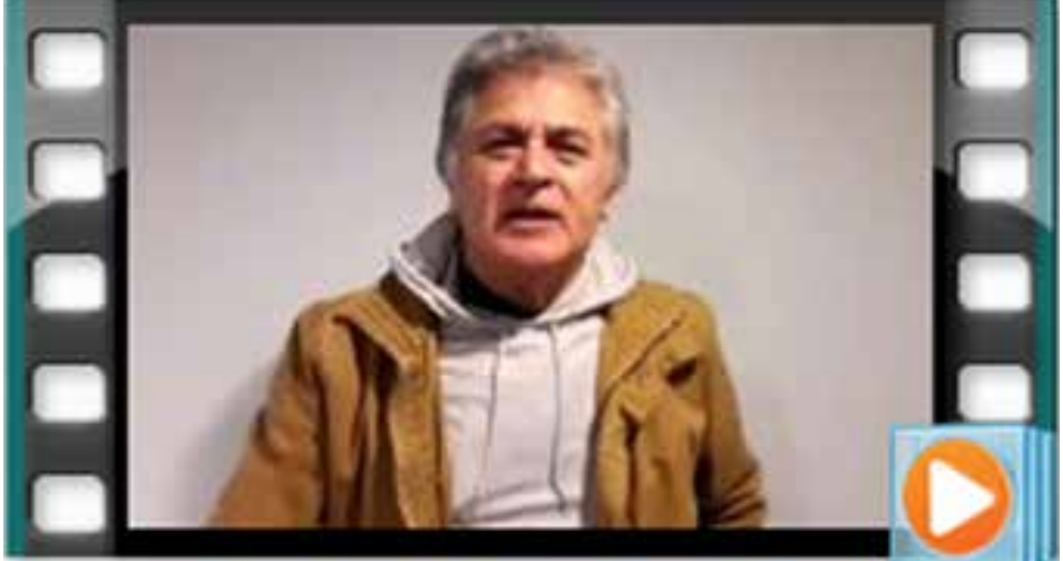
DALE PLAY PARA VER EL VIDEO DEL PATO FILLOL

Uniendo Riverplatenses de todo el mundo, donde exista una piedra levantaremos una bandera de River Plate. Email: riverbuenosaires@hotmail.com - Facebook: Mi Patria Solidario // Mi Patria es River Info Twitter: @mipatriariver - Instagram: Mi Patria es River.