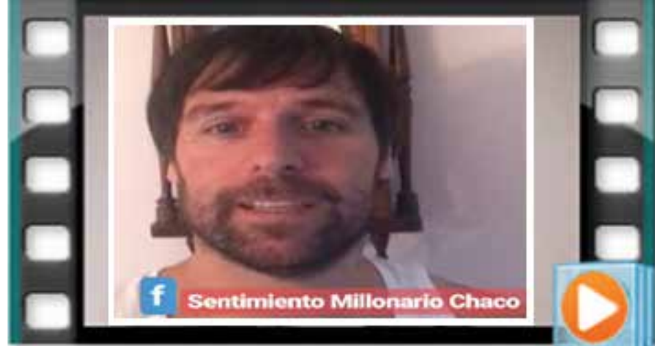
DALE PLAY PARA VER EL VIDEO DEL CAVEGOL