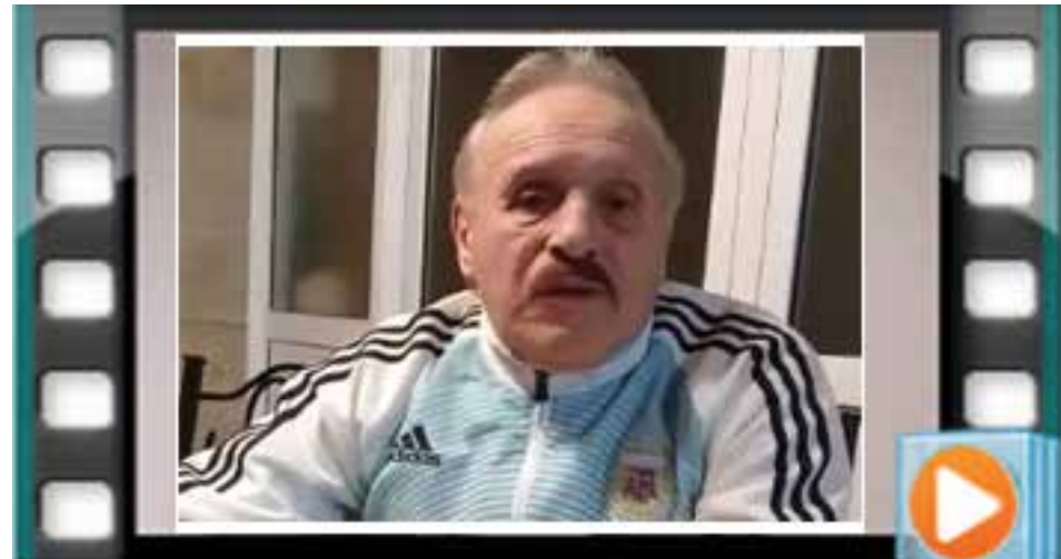
DALE PLAY PARA VER EL VIDEO DE LUQUE