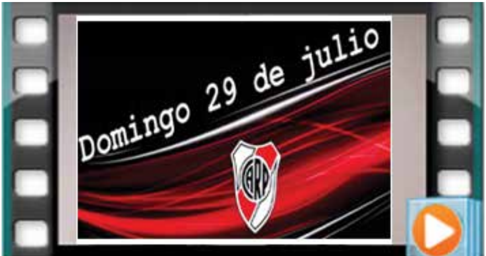
DALE PLAY PARA VER VIDEO DE LA FILIAL CRESPO